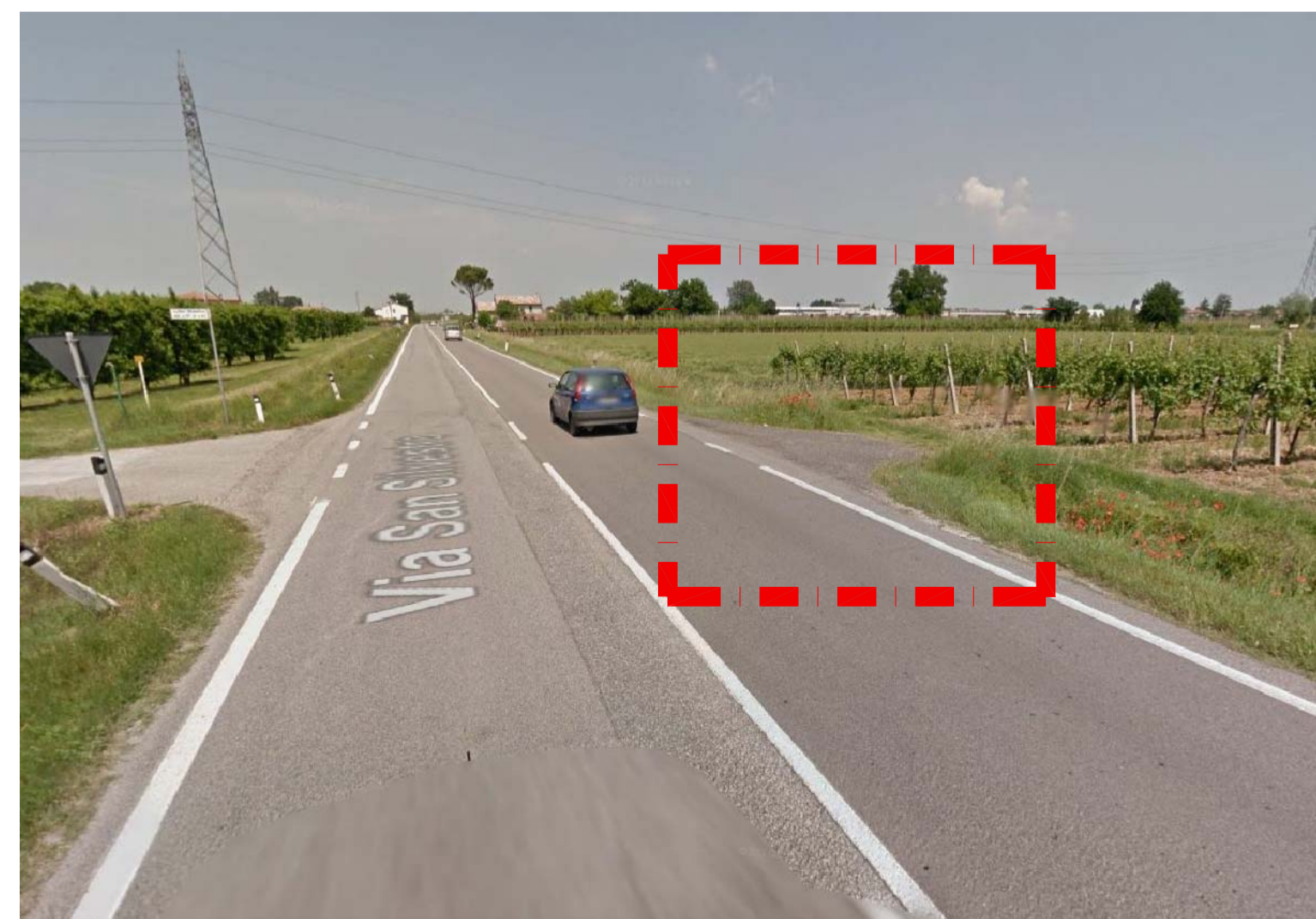
FOTO DA VIA S.SILVESTRO - STATO ATTUALE