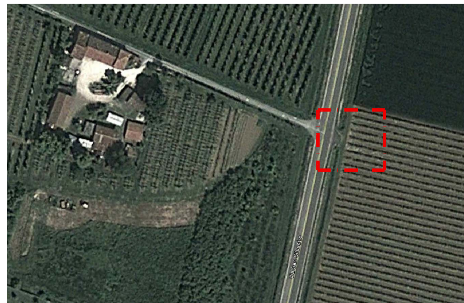
FOTO AEREA - STATO ATTUALE